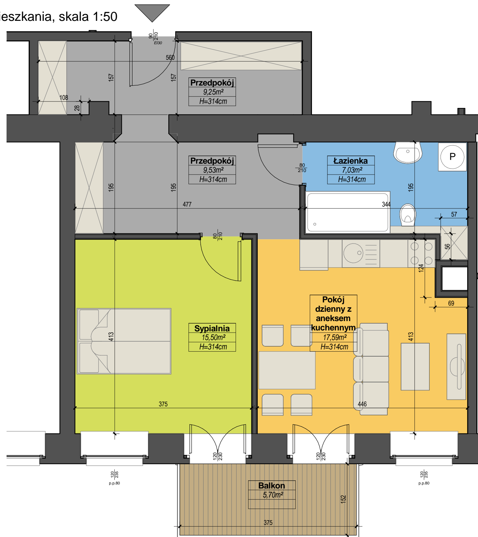
Plan mieszkania, skala 1:50